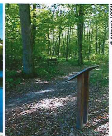
La forêt, sujet de découvertes...