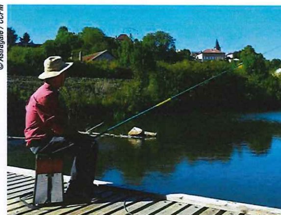
Pêche sur le Madon