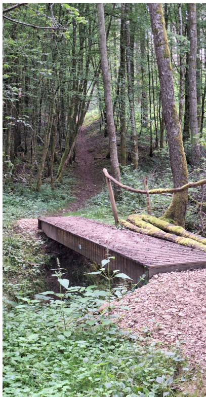
Passerelle sur le sentier