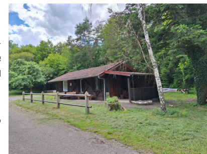
Abri de chasse