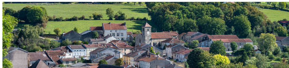
Ville sur Illon

Hébergement OT Mirecourt : 03 29 37 01 01.