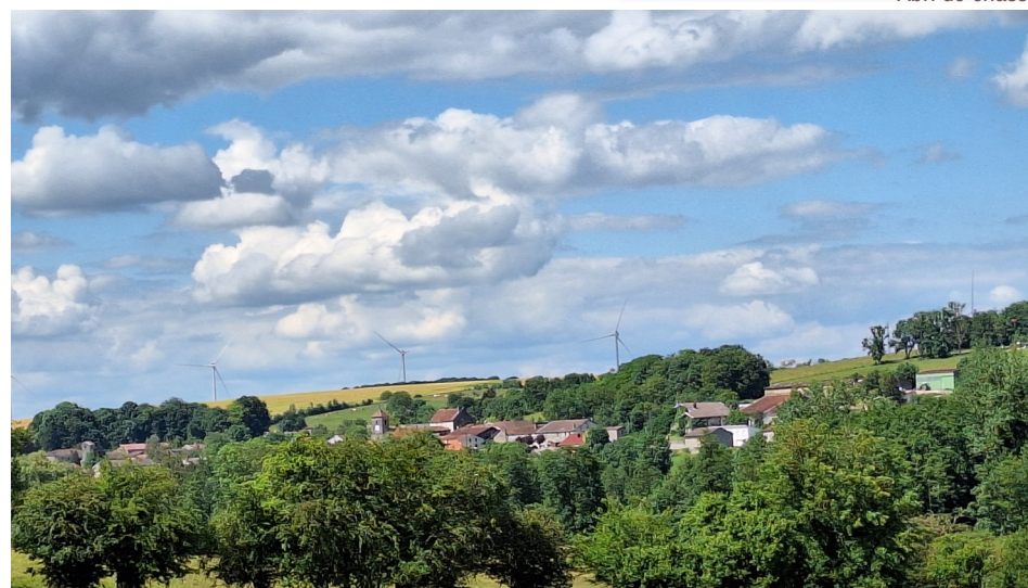
Vue sur le village