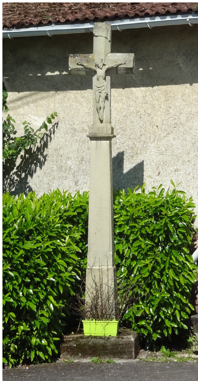
Le calvaire du pont bâtard